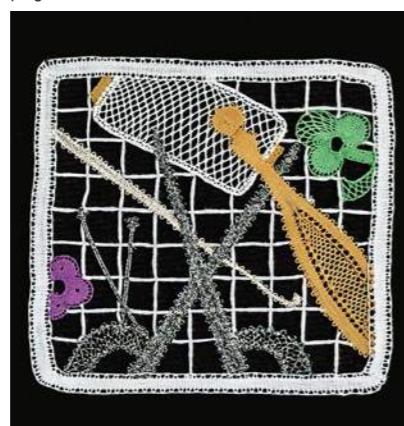
'Nel Mondo del Merletto', Cantù, 2017, cm 10x10, progetto e realizzazione di Graziella Cincotto.